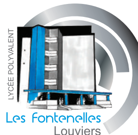
LYCÉE POLYVALENT Les Fontnelles Louviers

Les métiers de la maintenance industrielle