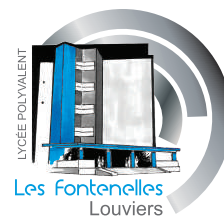
LYCÉE POLYVALENT Les Fontnelles Louviers